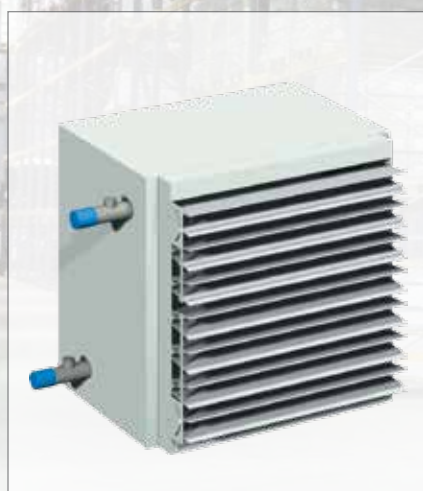
Uitvoering gelakt, met uitblaasmond type AU.11